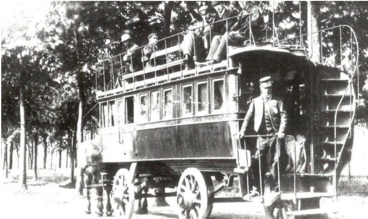
Afb. De railroader, hier gefotografeerd aan toen het eindpunt, het Kalverbosch. Pas in 1880 werd het eindpunt verlegd naar de Rotterdammerpoort.

Op 24 juni 1866 vond de officiële openingsrit plaats: de lijn liep van het Huygensplein in Den Haag naar het Kalverbosch te Delft. De voertuigen waren van Frans fabricaat. De eerste jaren na de opening in 1866 werd de verbinding onderhouden door een heel bijzondere paardentram; de railroader. Een rijtuig dat zowel op rails als op de straat kon rijden. Dit was nodig omdat op de Hoornbrug in Rijswijk en bij de gelijkvloerse kruising met de trein van Den Haag naar Leiden op de Rijswijkseweg geen rails lagen. Deze railroader was een zwaar rijtuig. Bij de Hoornbrug had het tweespan moeite om er tegenop te komen en moest er een derde paard worden ingezet.